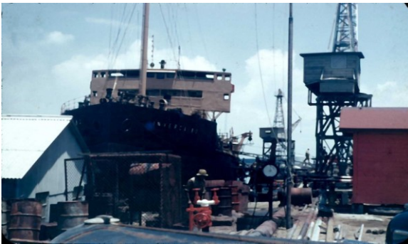
Drydock di Lago

E prome tankeronan a wordo suministra y maneha pa Andrew Weir & Co., Ltd. di London y mayoria di e oficialnan y algun di e tripulacion tabata hombernan di Marinero Comerciantenan Ingles y mayoria tabata Escoses. Hopi e oficialnan tabatin famia cu tabata biba den Lago Colony, mientras nan casanan tabata nabega di Aruba pa Maracaibo y visa versa. Tur e mantencion di e tankeronan aki tabata wordo haci pa Lago su drydock. Con largo e flota di e tankeronan a wordo maneha pa e compania aki nos no por a haya ainda.